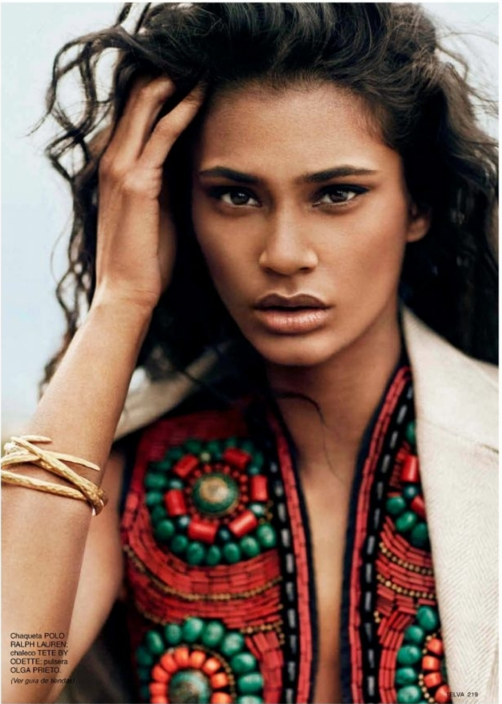
Chaqueta POLO RALPH LAUREN; chaleco TETE BY OETTE; pulsera OLGA PRIETO. (Ver guía de tiendas)