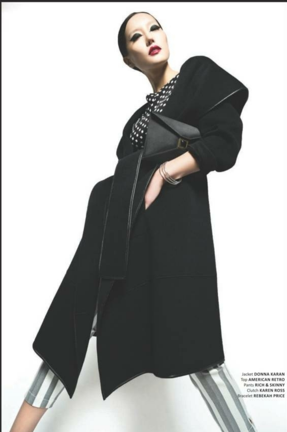
Jacket DONNA KARAN Top AMERICAN RETRO Pants RICH & SKINNY Clutch KAREN ROSS Bracelet REBEKAH PRICE